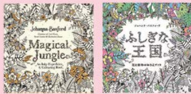
原題：Magical Jungle 邦題：ふしぎな王国

第4弾目となる「ふしぎな王国」は原題「Magical Jungle」の日本語版です。ジョハンナ代表作「ひみつの花園」や「海の楽園」は世界的にミリオンセラーを打ち出しています。