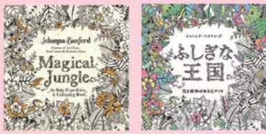
原題: Magical Jungle 邦題: ふしぎな王国

第4弾目となる「ふしぎな王国」は原題「Magical Jungle」の日本語版です。ジョハンナ代表作「ひみつの花園」や「海の楽園」は世界的にミリオンセラーを打ち出しています。