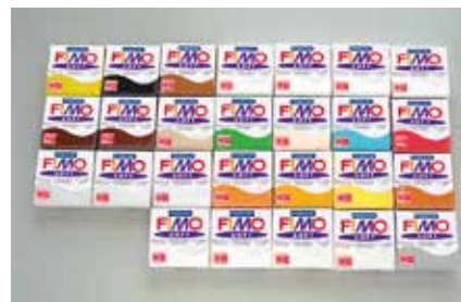
道工具+教材セット+ねんど